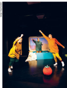
Die Inszenierung war bunt und kinderfreundlich

spielerisch vermittelt wurden, die im Stück später Anwendung fanden. Kinder mit ihrer Begleitung lernten ein paar Ein-Wort-Gebärden wie SCHOKOLADE, ELTERN, BLAU und erfuhren, dass Mimik, Gestik und Körpersprache wichtige Bestandteile der Deutschen Gebärdensprache sind.